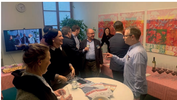
Apéritif avec proFonds au bureau de proFonds à Bâle 21 mars 2023

En 2023, nous avons organisé trois événements :