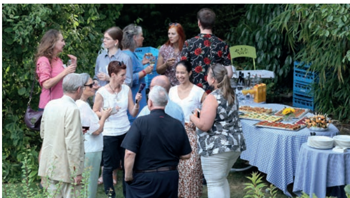
Apéritif avec proFonds chez OceanCare à Wädenswil 24 août 2023