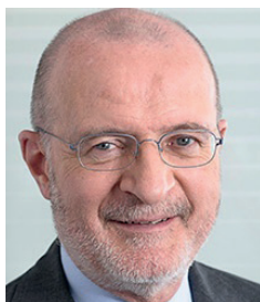
M. Fulvio Pelli Lugano