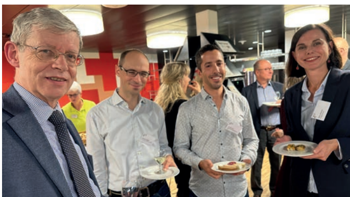
Apéritif avec proFonds chez la Croix-Rouge suisse CRS à Berne 24 octobre 2023

proFonds remercie chaleureusement les hôtes de ces événements !