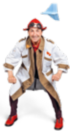
Dr. Tripp Trapp