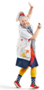
Dre Méli Mélo