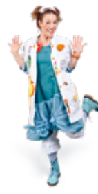
Dre Lili PoP