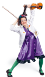
Dre Double Croche