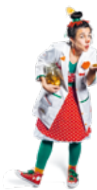
Dre Piri Piri