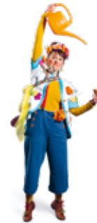
Dre Tante Flora