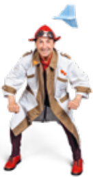
Dr Tripp Trapp