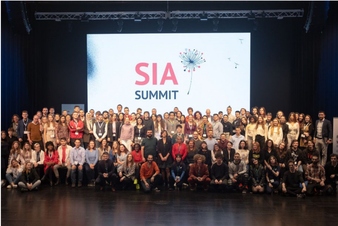
ABB. 6: SIA SUMMIT 2022