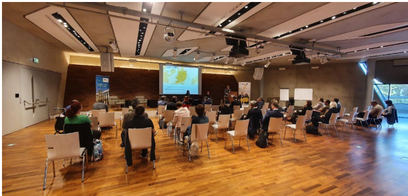
ABB. 12: DIE KONFERENZ IM FESTSAAL 1 DER WU WIEN

Abschließend präsentierten die Projektpartner wichtige Learnings und Handlungsempfehlungen. In den beteiligten Ländern wird die Bekämpfung von Arbeitslosigkeit sehr stark als Aufgabe des Staates wahrgenommen. Bislang gibt es kaum Geschäftsmodelle, die das Thema für Impact Investoren interessant