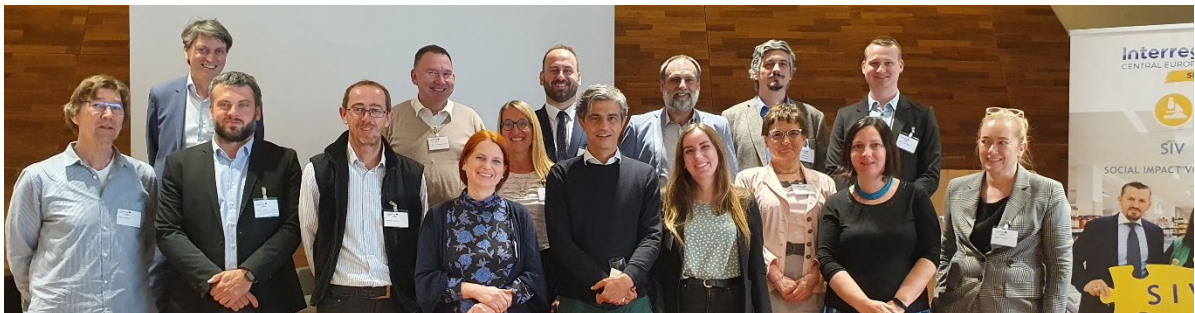
ABB. 13: DAS INTERNATIONALE PROJEKTTEAM VON INTERREG SIV

Die Videoaufnahmen der einzelnen Sessions sowie die Präsentationsunterlagen der Vortragenden finden Sie hier auf der Konferenzseite. Weitere Informationen über das SIV-Projekt sind hier auf der Projektwebseite erhältlich.