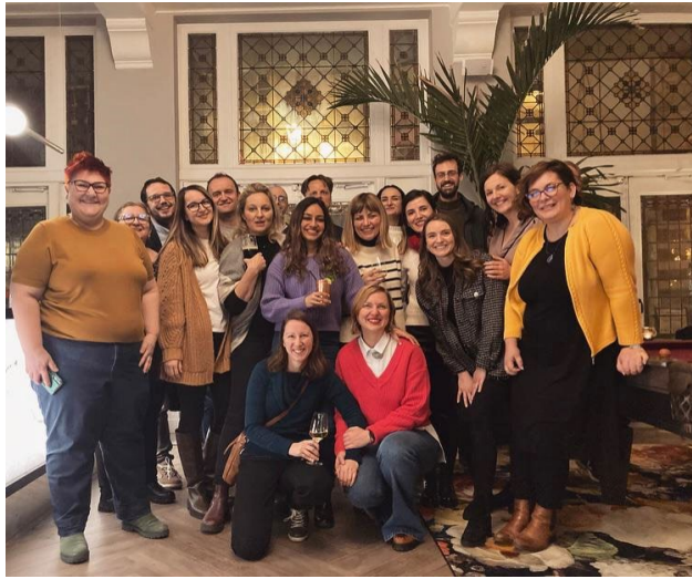
ABB. 4: DIE ERSTE KOHORTE DES PROFESSIONAL MASTER IN DEN HAAG

Die erste Kohorte wird Ende Juni 2023 ihren Abschluss feiern. Die zweite Kohorte steht bereits in den Startlöchern und wird im März 2023 das Masterprogramm beginnen. Wir wünschen bereits jetzt viel Erfolg!