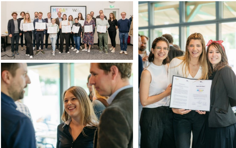
ABB. 1: TEILNEHMENDE INITIATIVEN BEIM ABSCHLUSS DER MEGA ACADEMY IM JUNI 2022

Ebenso freuen wir uns über die Fortsetzung des Wachstumsprogramms der MEGA Academy im Jahr 2023 mit Bildungsinitiativen, die sich für Chancenfairness einsetzen.