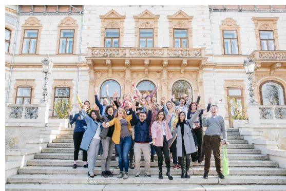
ABB. 8: TEILNEHMENDE DES SOCIAL INNOVATION AND MANAGEMENT PROGRAMME 2022