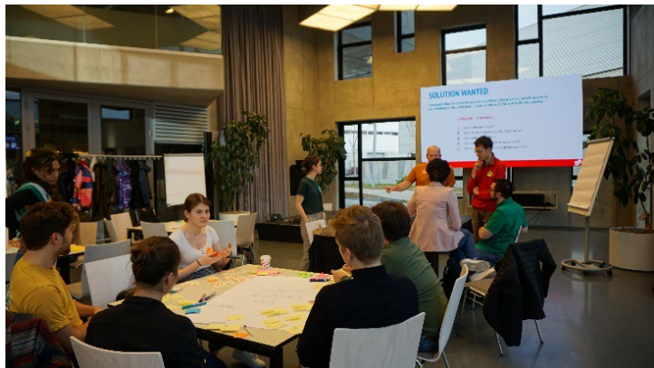
ABB. 5: WORKSHOP DES SOCIAL IMPACT AWARD

Auch 2022 konnte der Social Impact Award wieder über 8.000 Jugendliche und Studierende in hunderten Workshops, Events und Webinaren erreichen. Der erzielte Impact ist beachtlich: 9 von 10 Teilnehmenden haben sich ein fundiertes Wissen über Social Entrepreneurship angeeignet, 7 von 10 haben Kompetenzen erworben, die ihnen helfen, ein eigenes Social Business zu gründen und 8 von 10 wurden inspiriert, im Impact-Sektor zu arbeiten.