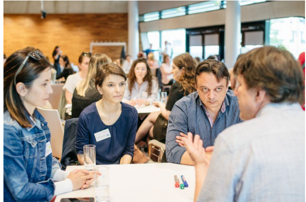
ABB. 9: DAS ERSTE ALUMNI MODUL MIT DREI KOHORTEN IM MAI 2022

Jedes Jahr werden die Alumni des Social Innovation and Management Programme ein Jahr nach Abschluss zu einem Alumni Modul eingeladen, bei dem die entstandenen Netzwerke gefestigt und für mögliche Kooperationen sowie gegenseitigen Austausch geebnet werden soll. Pandemiebedingt konnten die Alumnimodule in den Jahren 2020 und 2021 nicht stattfinden und so wurde im Mai 2022 erstmals für die Alumni der Durchgänge 2019, 2020 und 2021 ein großes zusammengelegtes Event realisiert. Die Umsetzung des Moduls für drei Kohorten im Mai 2022 fand großen Anklang und sorgte für umso mehr Vernetzungsmöglichkeiten.