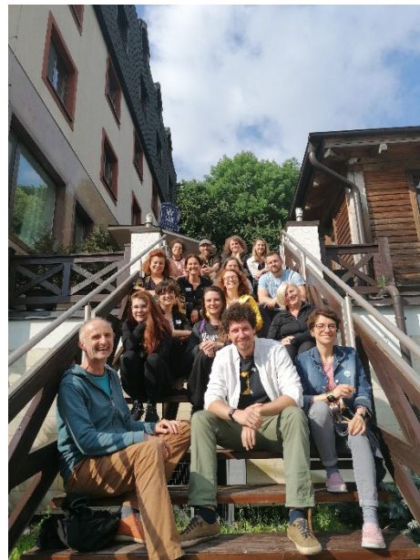
ABB. 7: WORKSHOP IM REGIONAL PROGRAMME IN BRATISLAVA IM JUNI 2022

Das bewerbungs-basierte Social Innovation and Management Programme richtet sich an Führungskräfte in NGOs und findet jährlich in drei einwöchigen Modulen statt. 25 Teilnehmende arbeiten mit Inputs der NGO Academy Faculty an ihren Kompetenzen in den Bereichen Design Thinking, Innovationen, Finanzierung, Projekt Management, Marketing, Leadership sowie Impact Measurement und erhalten die Möglichkeit, das Gelernte mit Unterstützung von Expert:innen direkt in eigenen Projekten umzusetzen.