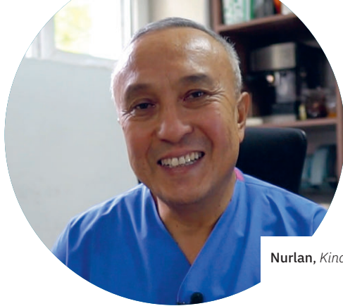
Nurlan, Kinderkrankenhaus in Bishkek