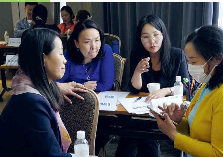
BPN Seminar in der Mongolei

Das wahrhaft Kraftvolle des «Unternehmertums» liegt in der Verbesserung des menschlichen Wohlergehens!